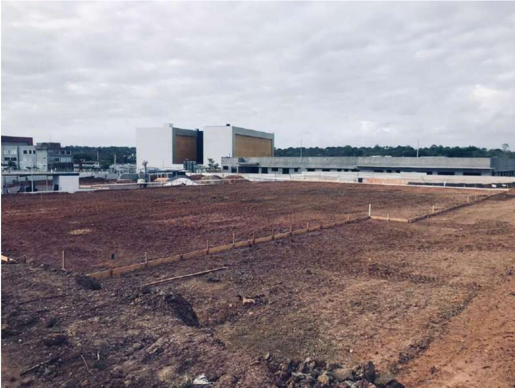
Foto 03: Visão geral vista de fundo, do gabarito da fundação da obra.