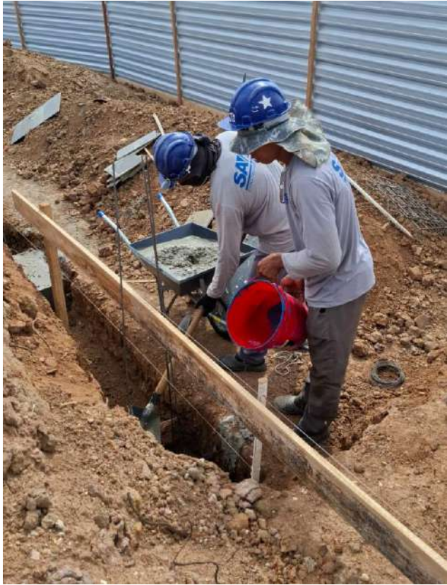
Foto 09: Início de execução da concretagem das sapatas do muro de contenção da frente da obra .