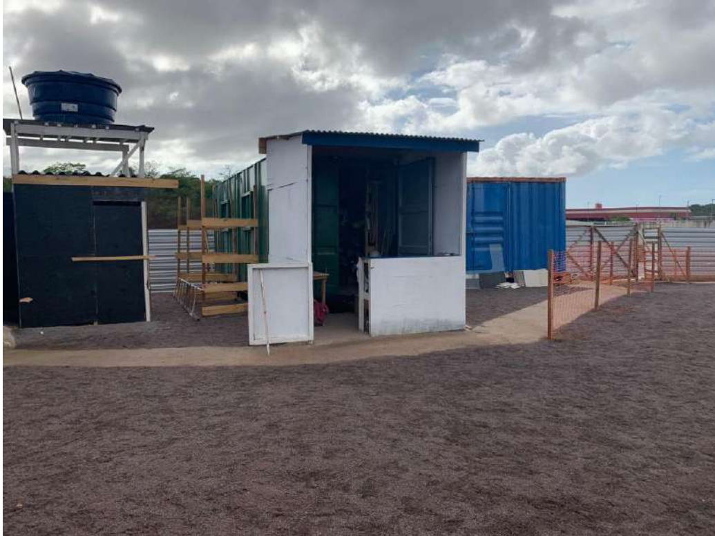
Foto 05: Visão do canteiro e container do escritório em azul e container verde do almoxarife.