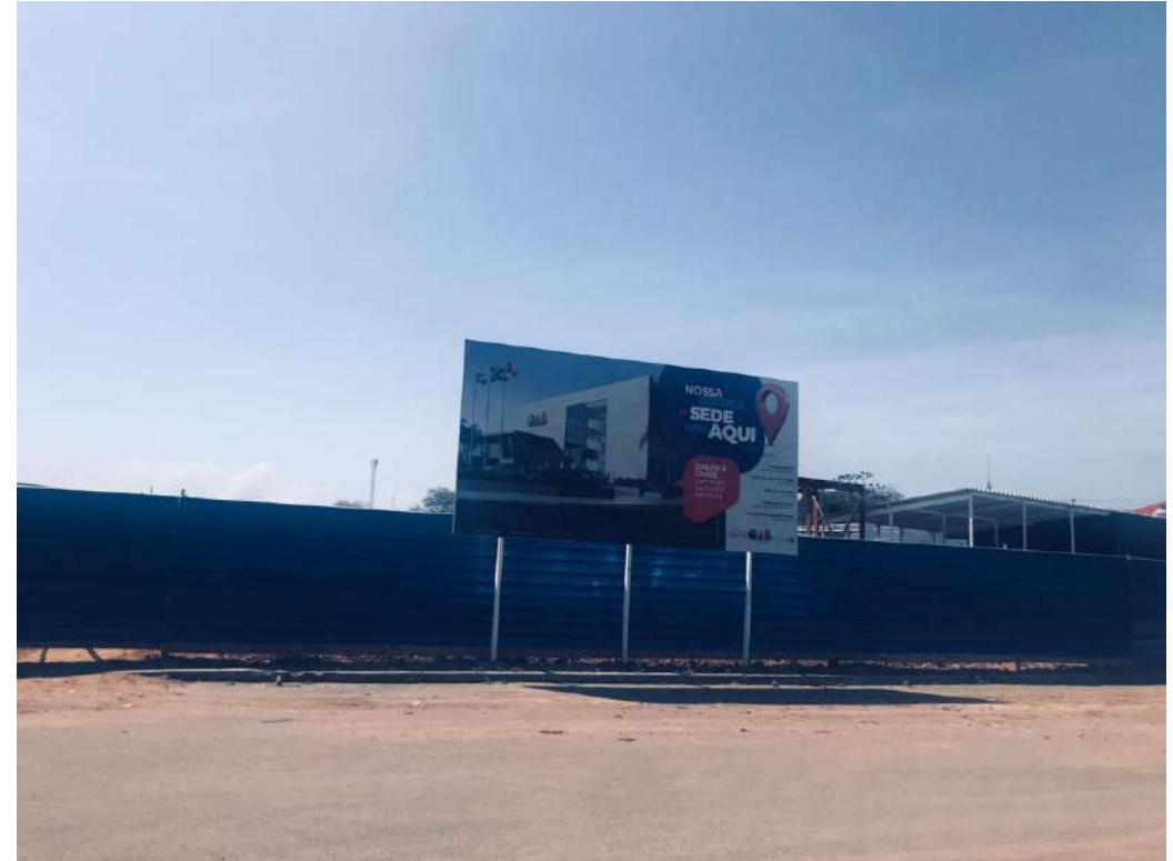
Foto 10: Finalização da pintura do lado direito do fechamento da obra.