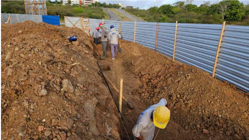
Foto 11: Realização da escavação da fundação do muro de contenção.