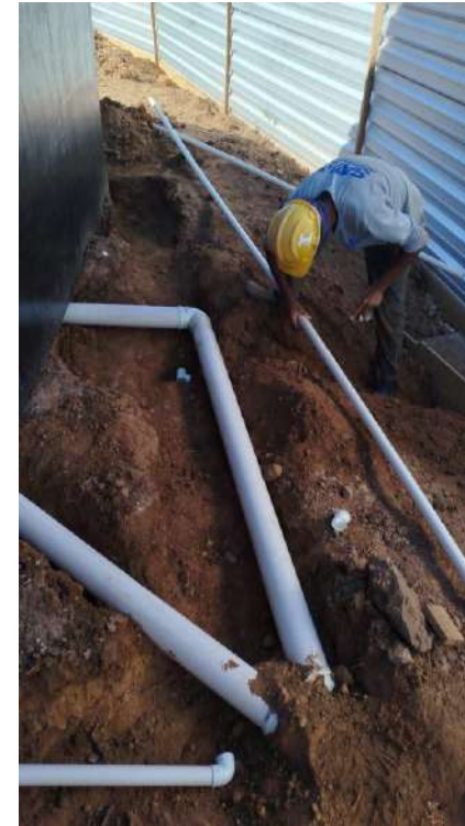
Foto 12: Realização das instalações de esgoto do canteiro de obra.