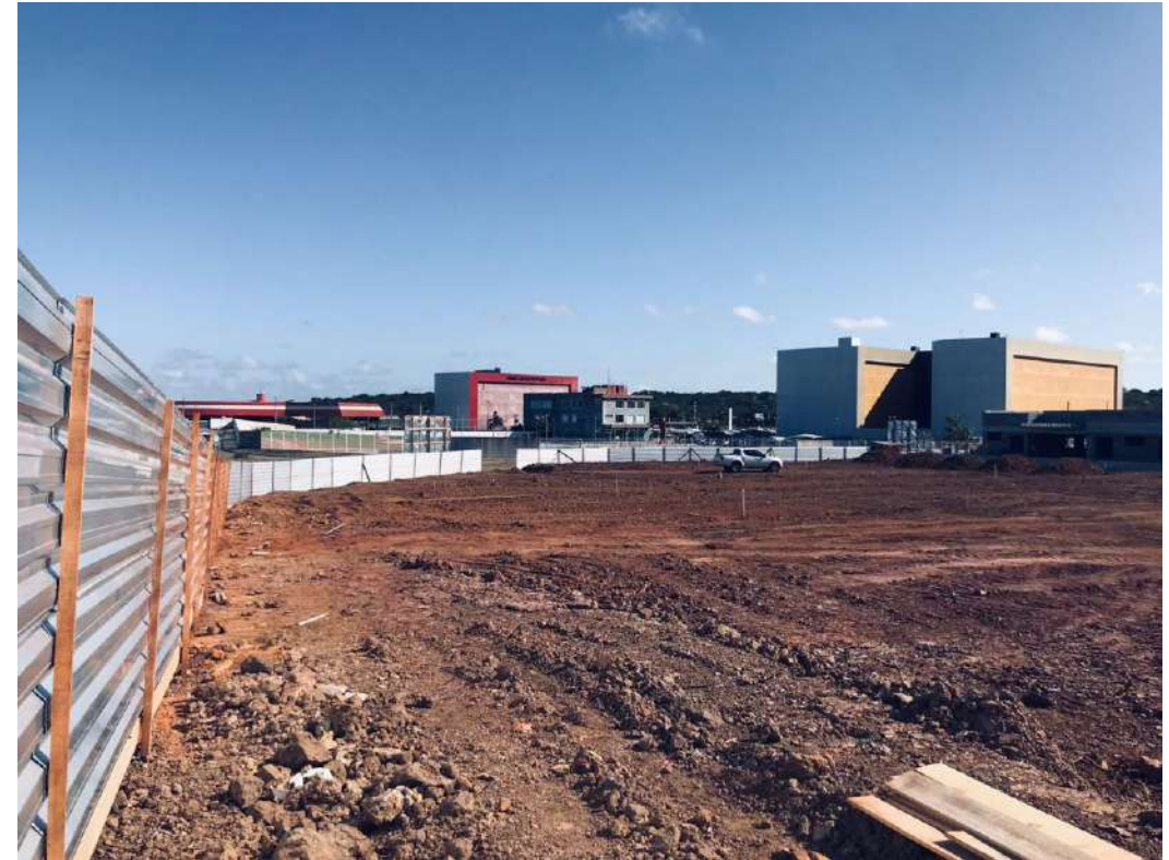
Foto 02: Visão interna da obra com nivelamento e terraplanagem finalizada.