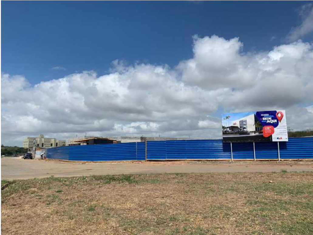
Foto 09: Finalização da pintura do lado esquerdo do fechamento da obra.