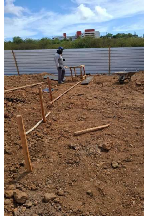
Foto 04: Início da execução do gabarito.